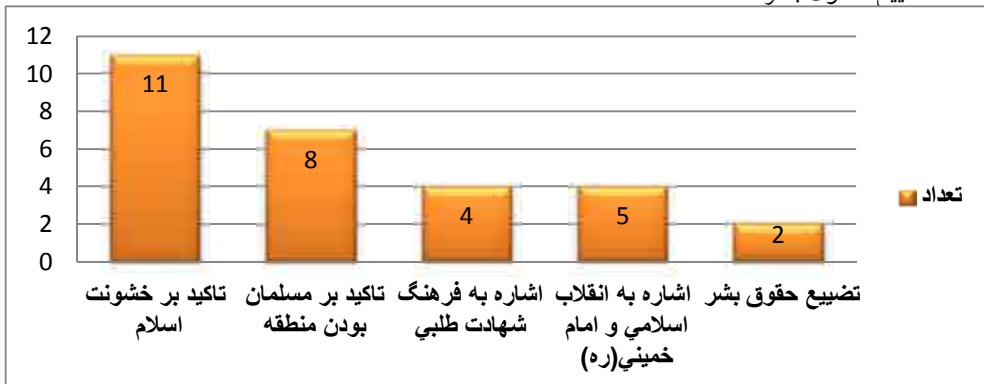
نمودار (۳) کارکرد نمادهای به کار رفته در فیلم‌ها